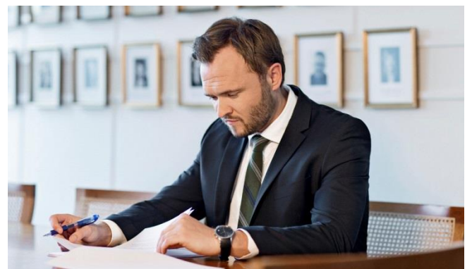
Dan Jørgensen Fødevareminister

Sammen skal vi gøre Danmark til Europas foretrukne destination for lyst- og fritidsfiskere.