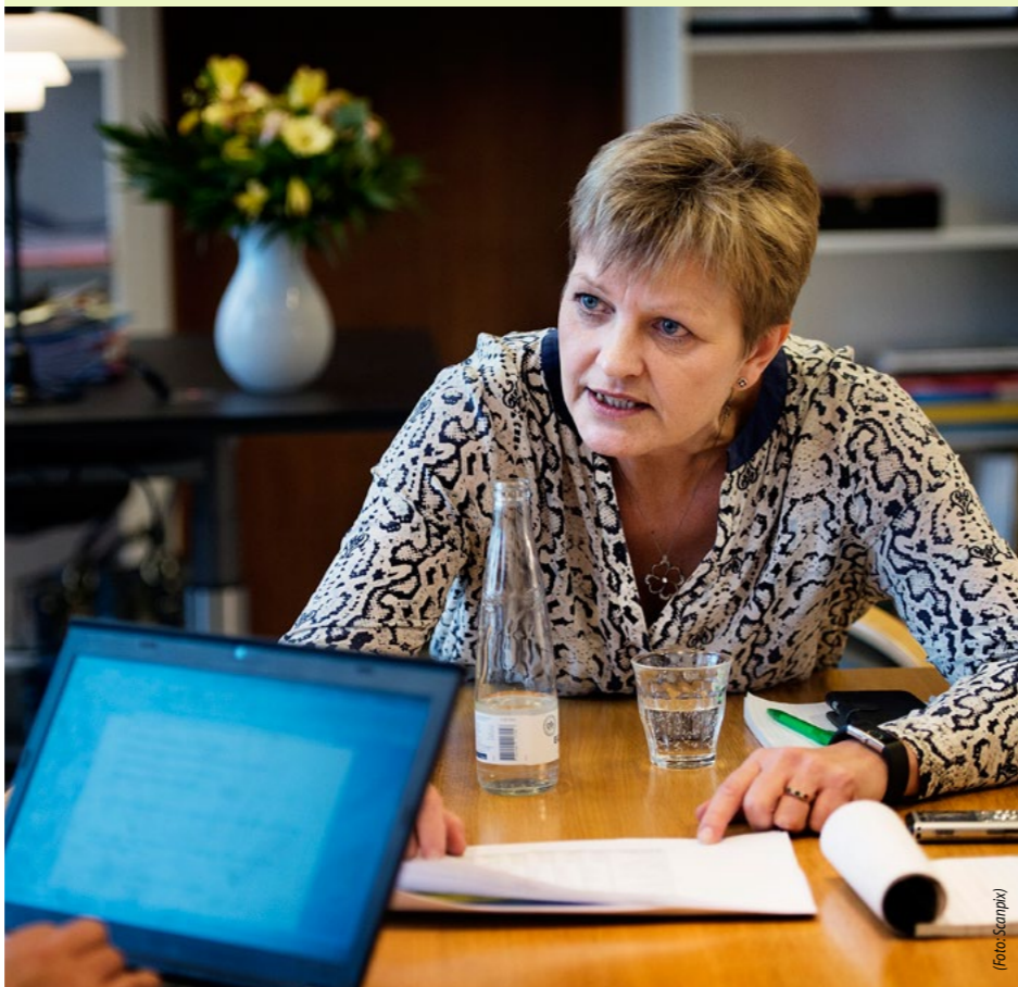
Miljøminister Eva Kjer Hansen

Alle miljøforskere i den offentlige debat om miljøministerens Landbrugspakke og Miljørapport er enige om, at Eva Kjer Hansens miljødata er uigennemskuelige, uden kilder og forfattere og ikke til at verificere. Nogle går så langt som til at kalde dem manipulerede – en omskrivning af data er vinklede og politiserede.