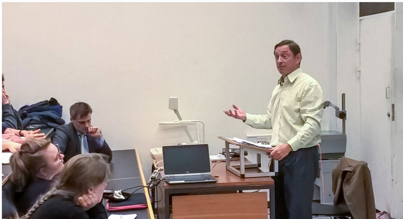
Guy Standing har mere end en teoretisk analyse med i kufferten – han har en politisk sag.

Professoren begynder med at tale om de grundlæggende faktorer – indkomstfordelingen er mindsket, de sociale indkomster oplever et "breakdown", folk må i